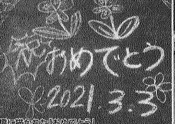
橋に描かれた「おめでとう」