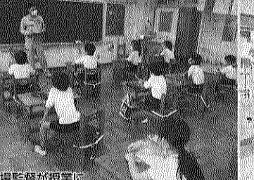
現場監督が授業に