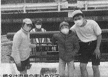
橋名は児童の書初め文字